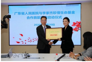
广东省人民医院携手李家杰珍惜生命基金救助项目启动