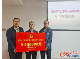
浙江温州共青团对口支援川疆藏同心共促脱贫